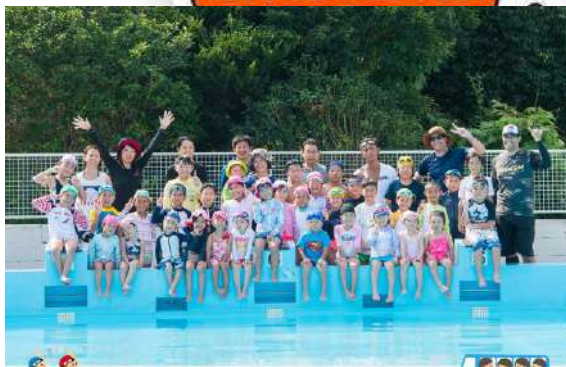
BELL KIDS ★ Summer Camp 2018.8.6-8